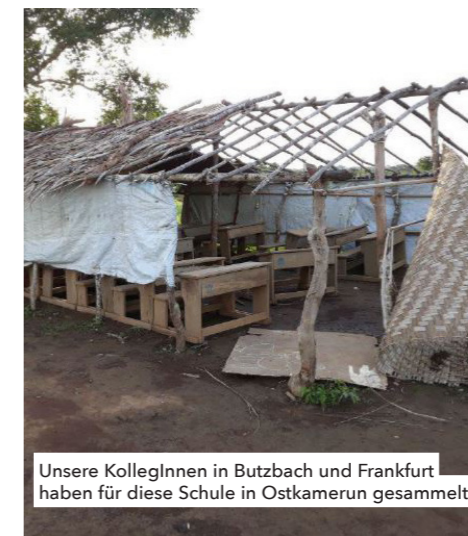
Unsere KollegInnen in Butzbach und Frankfurt haben für diese Schule in Ostkamerun gesammelt.